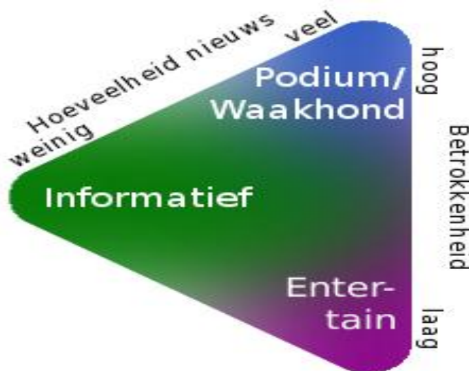
Figuur 1. Kenmerken van berichtgeving en functies van dagbladen in onze samenleving

Koppelen we deze betrokkenheids-aspecten van het nieuws over rechtszaken aan de verschillende functies die nieuws heeft, dan kunnen we daarbij tot het volgende onderscheid komen.